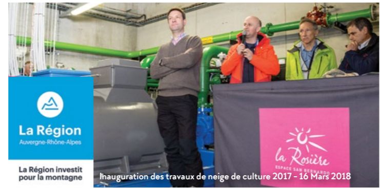
La Région Auvergne-Rhône-Alpes

Au total, ce ne sont pas moins de 740 000 € HT qui ont été investis dans la neige de culture pour 2017 et 2018 avec une subvention à hauteur de 194 487 € versée par la Région.