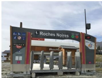
Renouvellement sur 5 ans des portiques et totems au départ des remontées. Budget global de 170 000 € HT.