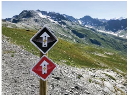
Balisage de 4 pistes eBike All-Mountain avant l'été 2018. Début des travaux d'une piste bleue de descente sous le télésiège de Roches Noires (en collaboration avec la Mairie). Pour l'été 2019, balisage de pistes eBike Enduro.