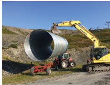
Ajout de nouveaux modules sur le Funcross du Petit-Saint-Bernard